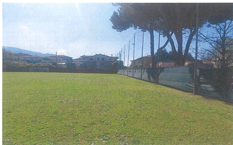
Reti Para Palloni