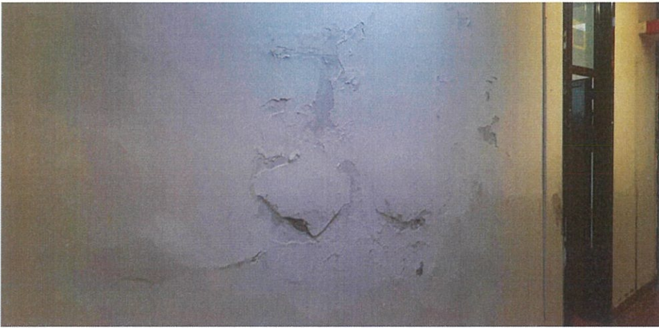
MURO CORRIDOIO AMMORSTO PER INFILTRAZIONI ACQUA DALLE DOCCIE